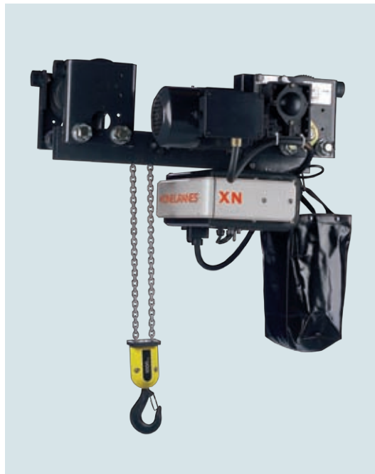
XN talė su žemo išpildymo vežimėliu