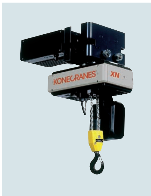
XN talė su motorizuotu vežimėliu